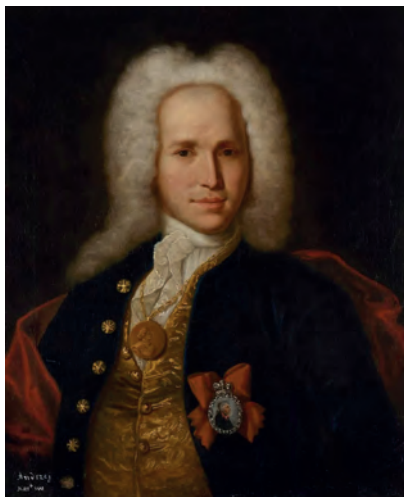
А.К. Нартов (1693–1756)

военного дела. Над военными изобретениями неустанно трудился в течение всей своей жизни любимый токарь Петра Великого Андрей Нартов . Им был сконструирован оптический прибор для нужд артиллерии, предложена машина для сверления стволов артиллерийских орудий, а в 1741 г. изобретена остроумная скорострельная батарея,