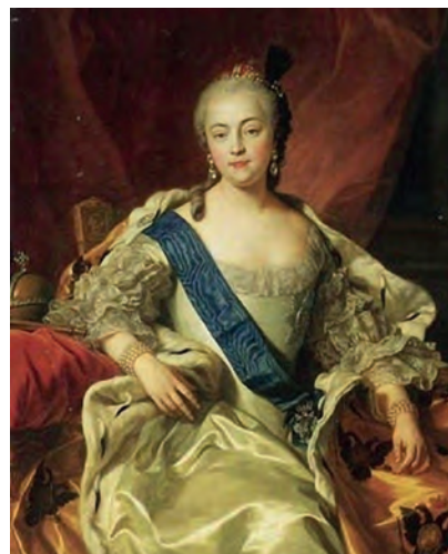
Елизавета Петровна (1709-1762)

Он угадывает моральное состояние прусского короля. Поражения, которые терпел Фридрих от русских войск, сломали его дух. Еще в 1757 г. он запасся ядом, который носил постоянно с собой. Он переходил от отчаяния к надежде и еще большему отчаянию. 12 августа 1759 г. Фридрих II поспешил сообщить, что разбил войска П.С.Салтыкова. Но русская конница тем временем пересекла пруссаков, а русская пехота вы-