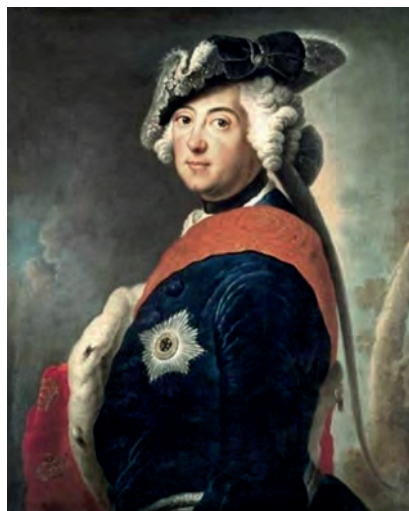
Фридрих II (1740–1786)

После смерти Елизаветы Петровны, императором стал 33-летний Петр III. Три первых месяца правления Петра III отмечены позорным завершением Семилетней войны. В первый же день своего царствования император направил Фридриху Великому грамоту о намерении установить с ним «вечную дружбу». 16 марта 1762 г. между Россией и Пруссией было подписано перемирие, а 6 мая — мирный договор. Русские